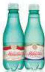
ÁGUA COM/SEM GÁS R$ 7,25