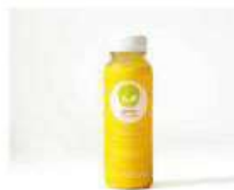
GREEN PEOPLE LARANJA 250ML / 1L R$ 12,50 / R$ 25,50