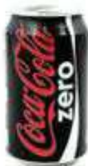
COCA ZERO R$ 8,30