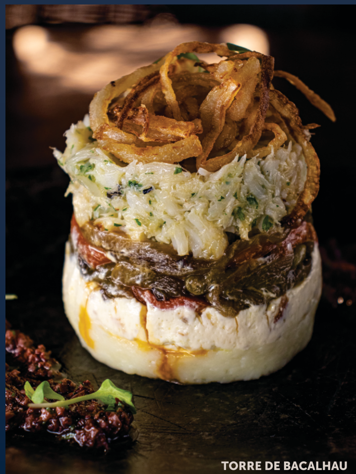
TORRE DE BACALHAU